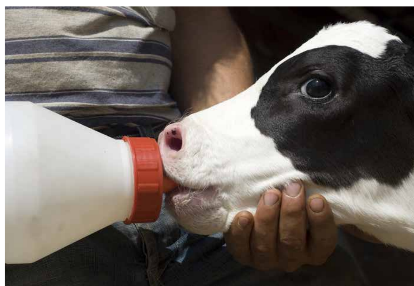
Voldoende goede biest moet!