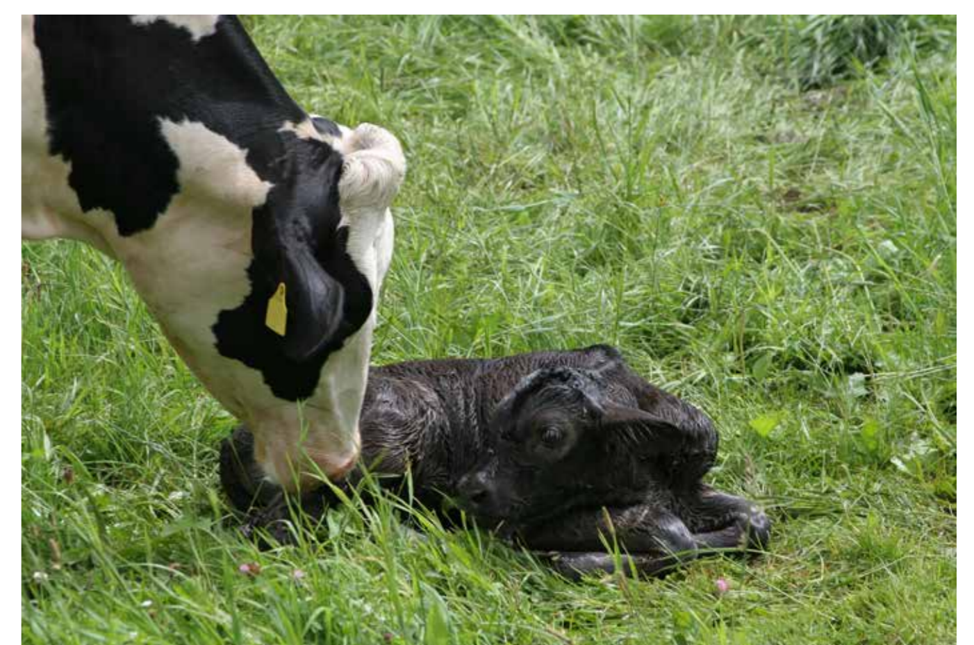
Interessante onderzoeksvragen liggen er op het terrein van het koe-kalf contact.