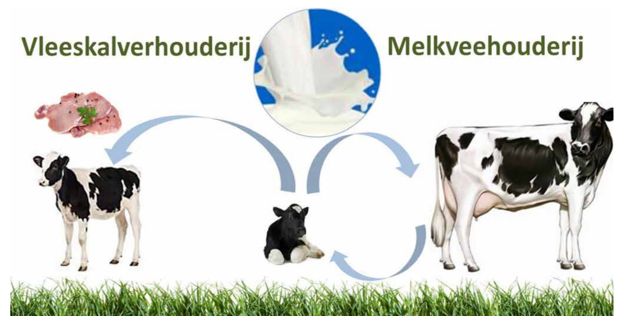
Figuur 2. Een goede opvang en opfok is essentieel voor goede prestaties later als melkkoe maar ook voor een weerbaarder kalf verderop in de vleeskalverketen.