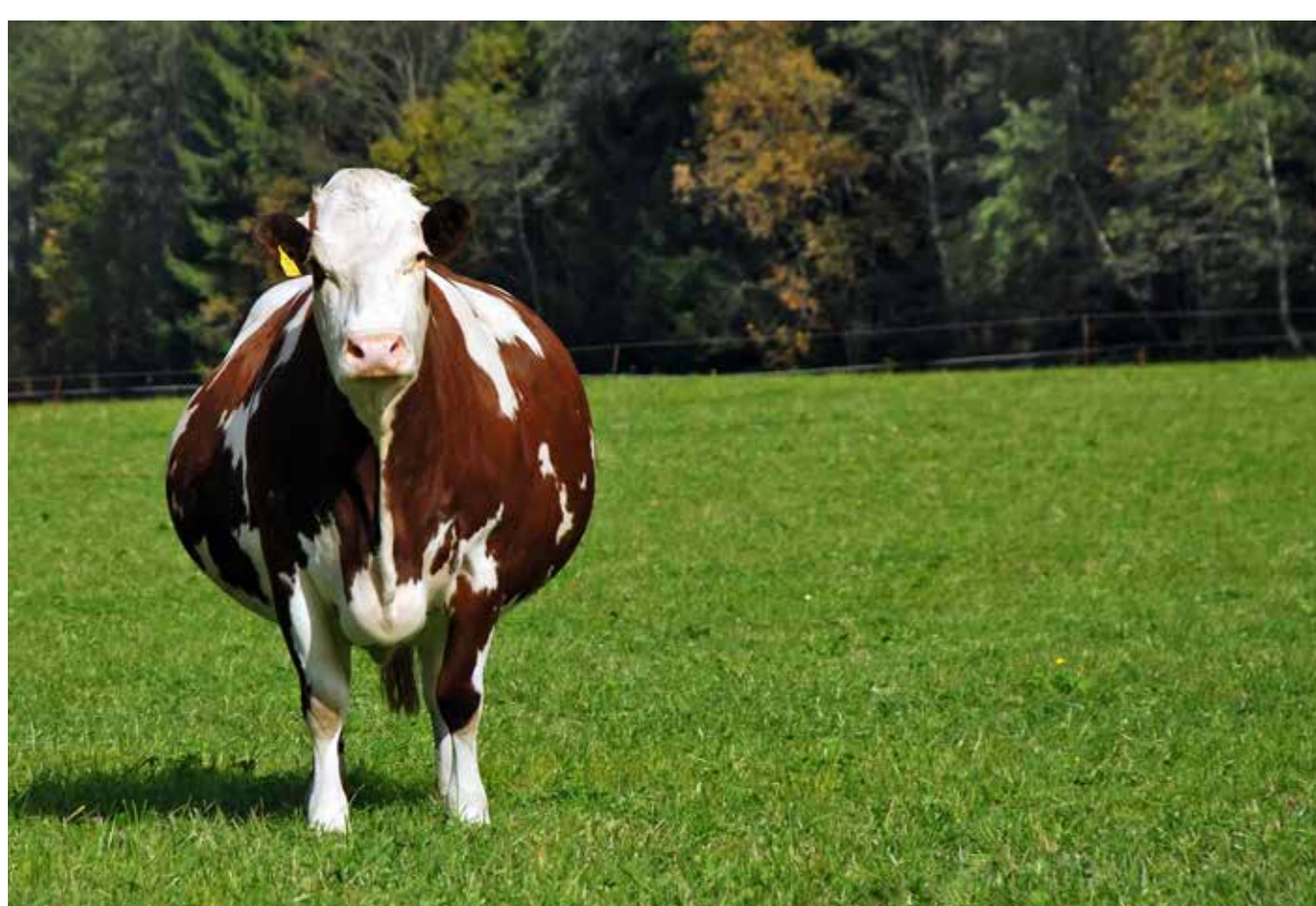
Omstandigheden tijdens de droogstand kunnen een effect hebben op het kalf.